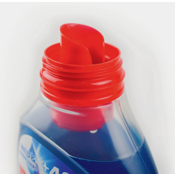
Nieuwe flesvorm met lekvrij systeem

We willen ook met een witte variant komen, dat is technisch iets moeilijker. De Bluetooth-enabled TargetScale communiceert met je smartphone, maar je hoeft de App niet te gebruiken want wie heeft er nu z'n telefoon bij zich in de badkamer. Het beheren van je lichaamsgewicht maken we hiermee eenvoudig en leuk, in plaats van teleurstellend en frustrerend."