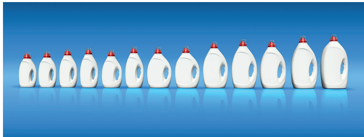
Platformontwerp voor Henkel

"Digital is ook bij ons een noodzakelijke component en we werken ook met Apps, maar we hebben geen enkele ambitie om helemaal 'digital' te worden. We zijn en blijven industrial designers met onze wortels in product design. Maar een telefoon bijvoorbeeld was ooit een apparaat met fysieke knoppen. Er zat op een gegeven moment een schermje op maar het bleef een fysiek ding. Langzamerhand zijn die knoppen verdwenen en is dat schermje zo groot geworden, dat het gewoon de hele telefoon is. Het is knap van Jonathan Ive (Apple's chief design officer) dat hij van een doosje nog een mooi doosje kan maken, maar de hele user experience speelt zich op dat scherm af. Dan kun je als industrial designer wel vasthouden aan het vormgeven van doosjes, maar het gaat natuurlijk om dat schermje. Dus ook onze producten krijgen steeds meer schermjes. Een mooi voorbeeld zijn inductiekookplaten waar we nu aan werken. Dat is eigenlijk een grote vlakke plaat zonder fysieke knoppen, pure user interface."