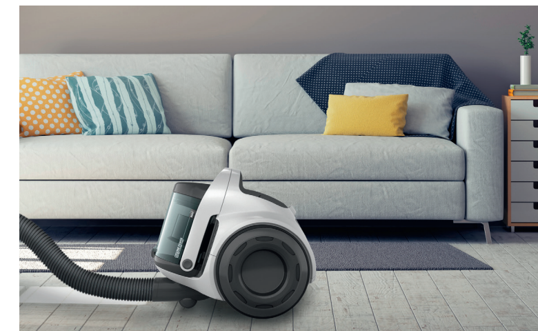
Westerse vormgeving voor Chinese bedrijven

"In China gaan ze dezelfde weg op als wij hier hebben gedaan. Je merkt het al aan het feit dat de productie van goedkope producten wegtrekt uit China, een groot deel van de textielindustrie maar ook