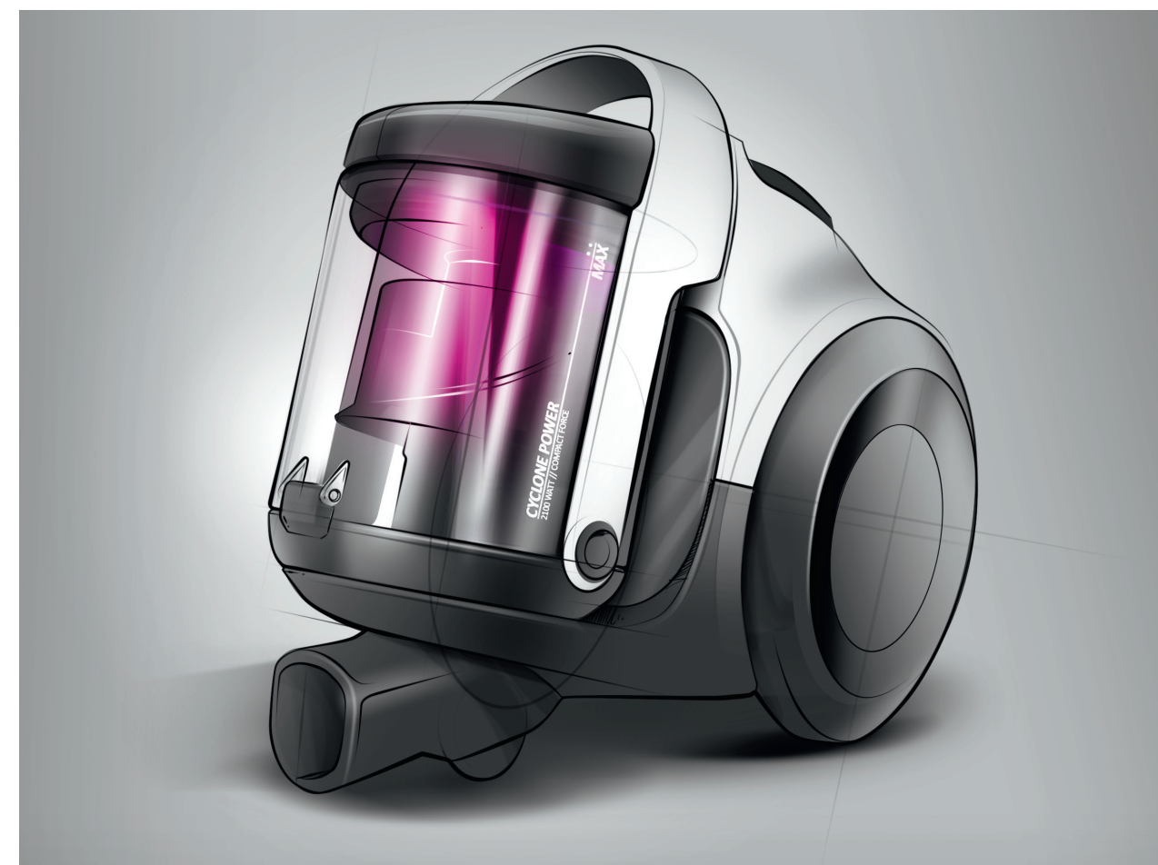
Stofzuiger voor Midea